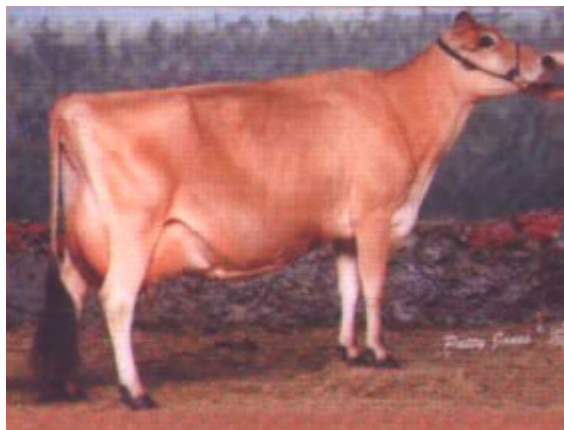
RON NET MAPLE DORIE DEE

A raça Jersey é conhecida pela uniformidade das características do seu tipo, por isso é a que mais se aproxima entre todas as raças leiteiras do "TIPO IDEAL LEITEIRO".